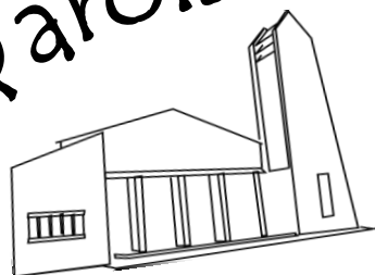
Ste Jeanne d'Arc